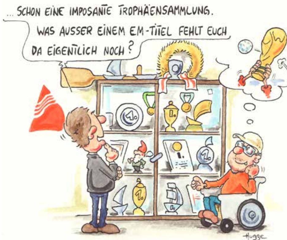
Cartoon von Phil Hubbe.

«Das ist gar keine einfache Frage. Zum einen würde mir ein schnelles, sportliches Boot gefallen. Andererseits erinnere ich mich gerne an die Bootsausflüge in meiner Kindheit. Die Papalagi liegt immer noch im Hafen von Arbon und ist ein richtiges Familienboot.»