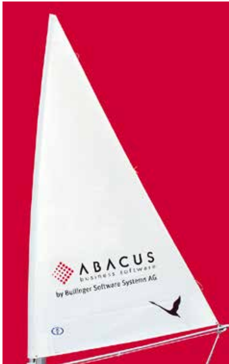
Das Segel des neuen Bootspartners.