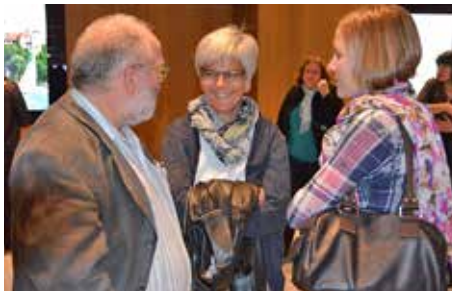
Rund 130 Gäste kamen anfangs November 2016 ins Würth Haus Rorschach.