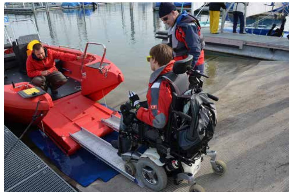
Über Rampen können Elektrorollstühle auf das neue Motorboot gelangen.

Dank der grosszügigen Unterstützung der Stiftung SYMPHASIS, der MBF Foundation Triesen und des Sportamts Thurgau kann Sailability.ch im Jahr 2018 eines der beiden Motor-Begleitboote ersetzen. Zusammen mit dem Bootsbauer Christoph Wirth von der Wirth Freizeit AG, Arbon, wird der Verein das neue Boot so ausrüsten, dass in Zukunft der Transport von Elektrorollstühlen sicher möglich sein wird. Das Team von Sailability.ch freut sich auf den Neuwert und wird zu einem späteren Zeitpunkt das Boot ausführlich vorstellen.