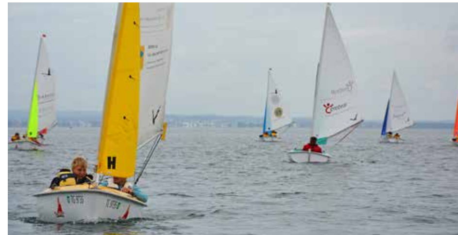
Am Schluss des Tages segelten die Schüler in einer Regatta um die Wette.