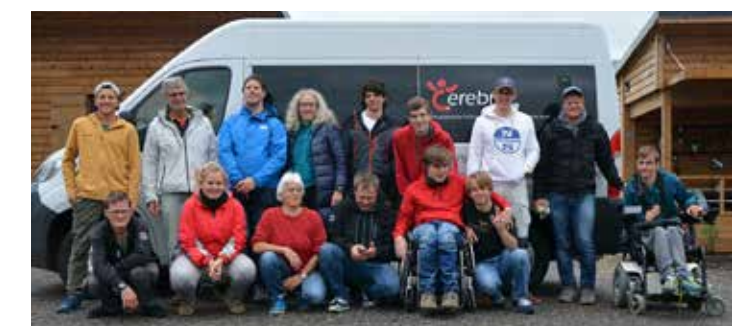
Trotz dem Wechselspiel von sommerlicher Hitze und kaltem Dauerregen machte das Abenteuersegeln allen viel Spass.