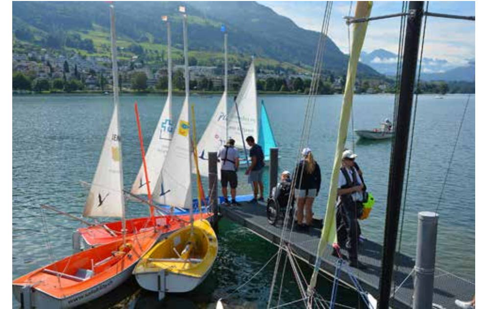
Start zu einer der fünf Etappen rund um den Bürgenstock.

Die erste Etappe führte von Küsnacht am Rigi nach Weggis Lützelau. Am nächsten Tag ging es weiter nach Luzern, wo die hungrige Segelgruppe vom Yacht-Club Luzern mit köstlichen Spaghettis verpflegt wurde. Auf der dritten Etappe zurück nach Weggis Lützelau passierten die Hansa 303 erneut den Bürgenstock, auf dem zurzeit ein luxuriöses Resorts entsteht. Die vierte Wegstrecke war von Dauerregen und herbstlich-kühlkalten Temperaturen geprägt. Sie endete im kleinen Hafen von Stansstad. Vor der Kulisse der kleinen Nidwalder Gemeinde gab es am letzten Segeltag bei idealem Wind einige Regatten. «Das war ein genialer Abschluss der Segelwoche», kommentierte ein Teilnehmer die Segelbedingungen. Während der ganzen Woche übernachteten die Teilnehmenden auf dem TCS-Campingplatz Buochs. Die barrierefreien Bungalows, die uns die Stiftung Cerebral freundlicherweise zur Verfügung stellte, erwiesen sich für die Campsteilnehmenden mit einer