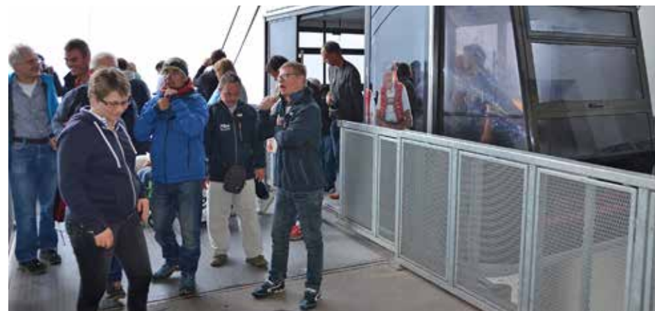
Das Rahmenprogramm der 6th Swiss Hansa Class Championships bot viel Abwechslung. Höhepunkt war eine Fahrt mit einem Saurer-Oldtimer nach Brülisau und der Seilbahn auf den Hohen Kasten.