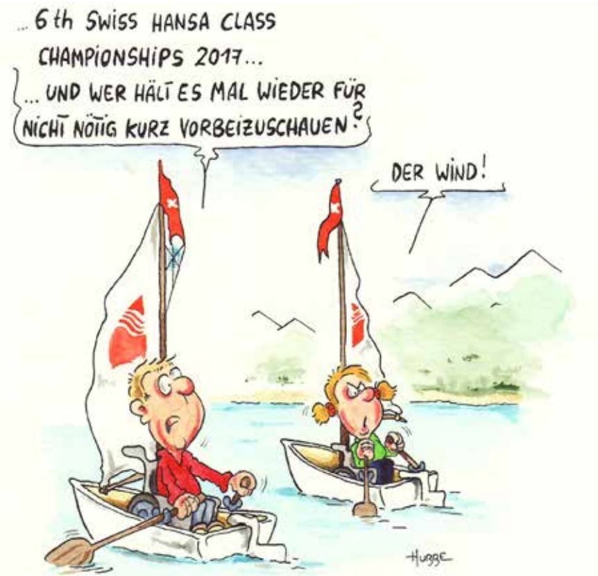
Cartoon von Phil Hubbe.

Olivier: «Die iPhone-App heisst SARA und erlaubt blinden und sehbehinderten Menschen, autonom einen Kurs zu segeln. Sie gibt unter anderem Angaben zur Geschwindigkeit, warnt vor Hindernissen oder kündigt eine notwendige Kursänderung an. Das Projekt wird mit Partnern laufend weiterentwickelt. Zurzeit ist sie in französischer, englischer, spanischer und italienischer Sprache erhältlich.»