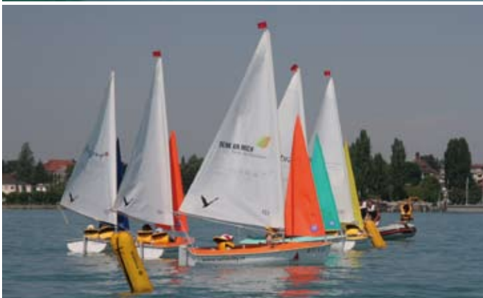
Segelkurs 2008 für Kinder und Jugendliche mit Behinderung