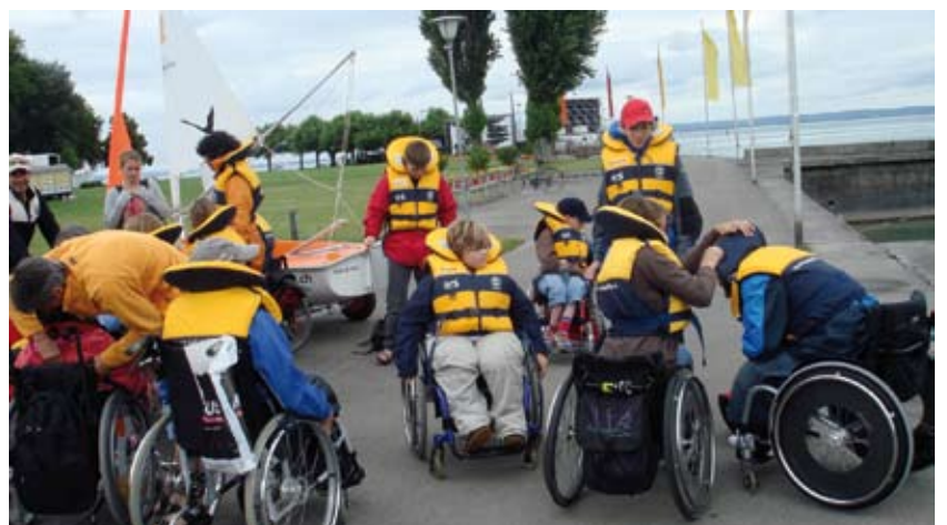
Segelkurs 2008 für Kinder und Jugendliche mit Behinderung