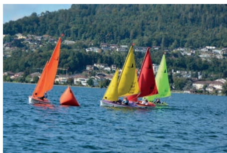
Runden an der Luv-Boje.

Die Swiss Hansa Class und Sailability.ch bedanken sich beim Thunersee-Yachtclub für die Gastfreundschaft und die hervorragende Organisation. Die Meisterschaft 2021 wurde von der Béatrice Ederer-Weber Stiftung, der Bommer Stiftung, den Firmen Losinger Marazzi und «die Mobiliar» sowie vom Rollstuhlsport Schweiz und PluSport Behindertensport Schweiz grosszügig unterstützt.