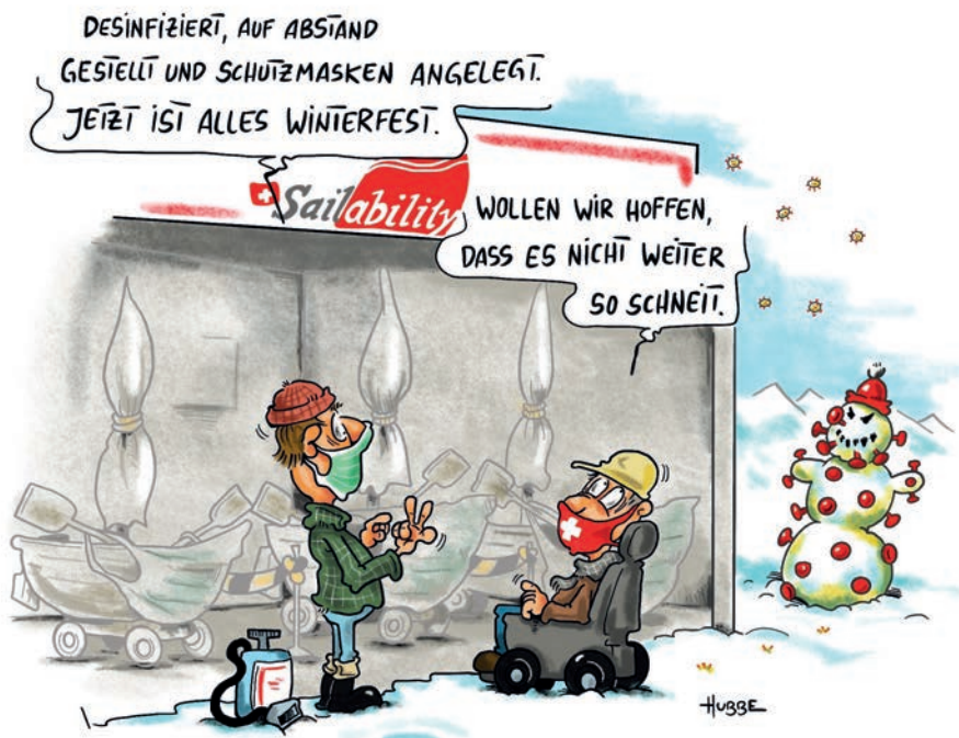
Cartoon von Phil Hubbe

Mit einem fulminanten Auftakt startete der dritte Segelkurs «Segeln auf dem Thunersee» am 15. August in Hilterfingen. Windstärken von 4-5 Beaufort, Regen und entsprechender Seegang zwangen uns gleich am ersten Tag, die Segel stark zu reffen und all unser Können auszupacken. Alle haben das grossartig gemeistert und waren ab da sprichwörtlich mit allen Wassern gewaschen. Ab Tag zwei ging es ruhiger zu und her und wir konnten am Nachmittag jeweils die thermischen Winde im Berner Oberland geniessen.