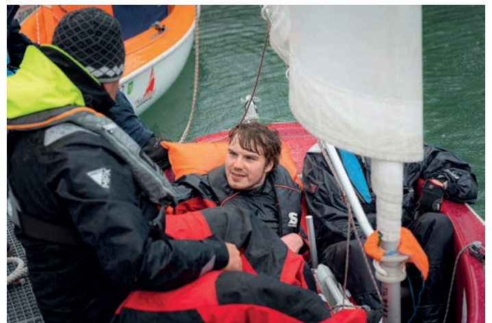
Fotos oben: Luftiger Blick auf den Steg in Kreuzlingen vor dem Auslaufen und zurück am Steg: klatschnass und gut gelüftet.