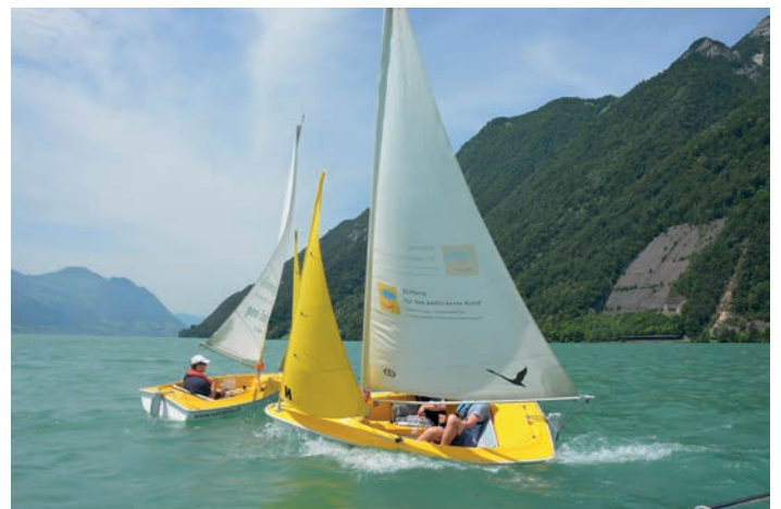
Foto oben: Die Kursschiffahrt wurde eingestellt, wir genossen die Vorfahrt auf dem See. Foto links: Zu Besuch in der Schokoladenfabrik Aeschbach, Root.