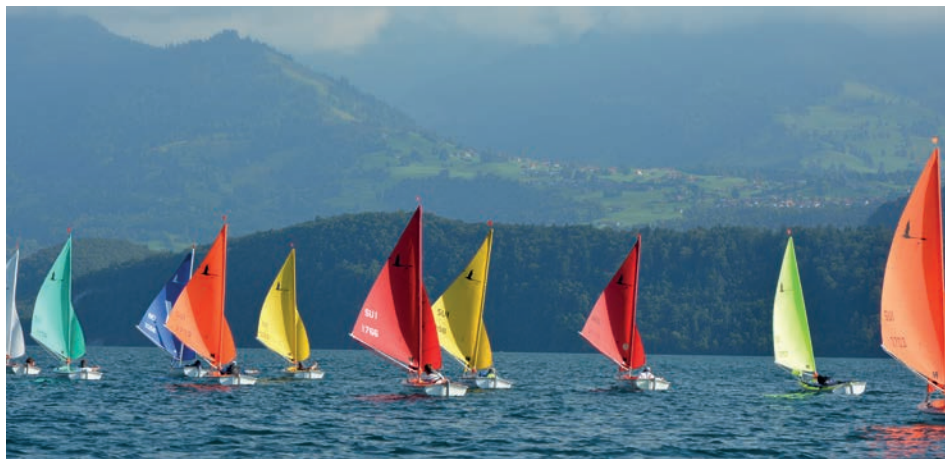
Auf dem Weg zur Lee-Boje.

Einmal im Monat vom Mai bis Oktober bieten wir einer Gruppe von Seglerinnen und Seglern einen stimmungsvollen Törn in den Abend an. Wir treffen uns jeweils um 17.30 Uhr und segeln dann bis ca. 19.30 Uhr. Hast du Interesse, dann melde dich an.