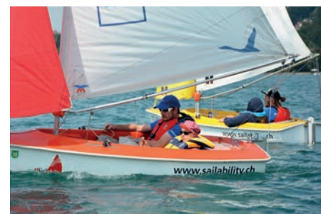
Impressionen von den PluSport-Segelcamps.