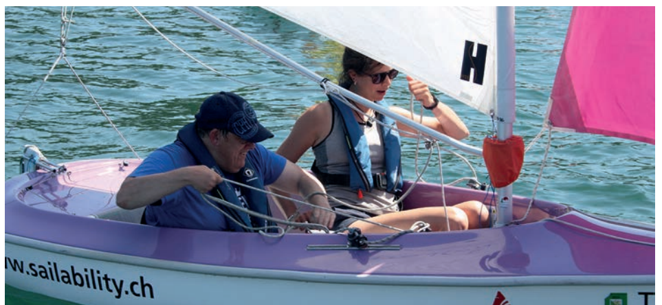
Ganz schön anstrengend, so ein Regattatag.