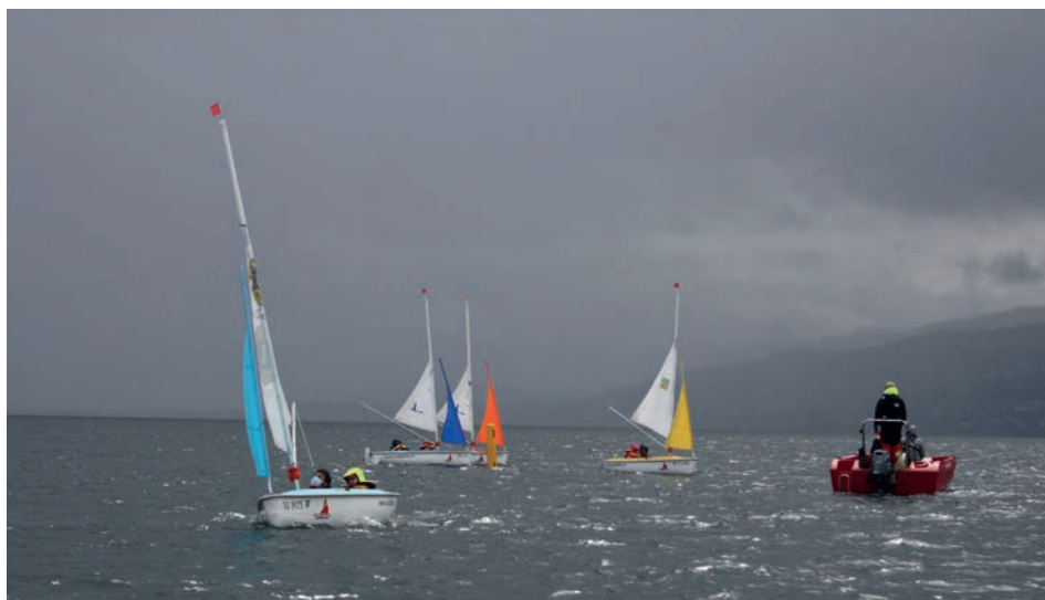
Schlechtwetter: Eine «Mutprobe» für die Schülerinnen und Schüler der GHG CP-Schule St. Gallen.