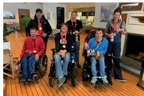
Die Medaillengewinner im Double.