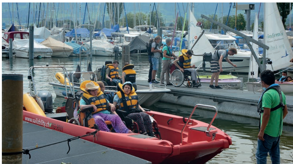
Auch für Menschen mit Mehrfachbeeinträchtigung ist ein Segeltag ein Erlebnis!