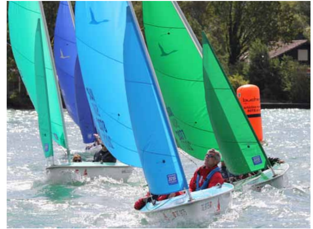
Au départ, les participants se sont battus pour chaque centimètre. Ensuite, il s'agissait de tourner au bon moment, afin de prendre le vent du «meilleur» côté après les bascules de vent et les rafales. Les conditions de vent ont forcé les équipes de la régate à adopter des tactiques de navigation audacieuses.