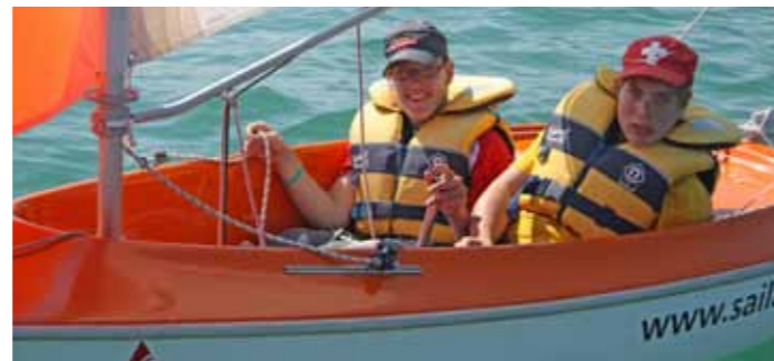
Enfants, jeunes et adultes: les amoureux de la voile de tous les âges passent des vacances sportives sur le lac de Constance