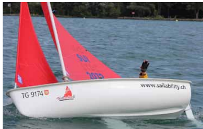
Un coup de main ne serait pas de refus! Les rafales et bascules de vent étaient parfois très fortes, les dériveurs ont par moments tangué de manière impressionnante.