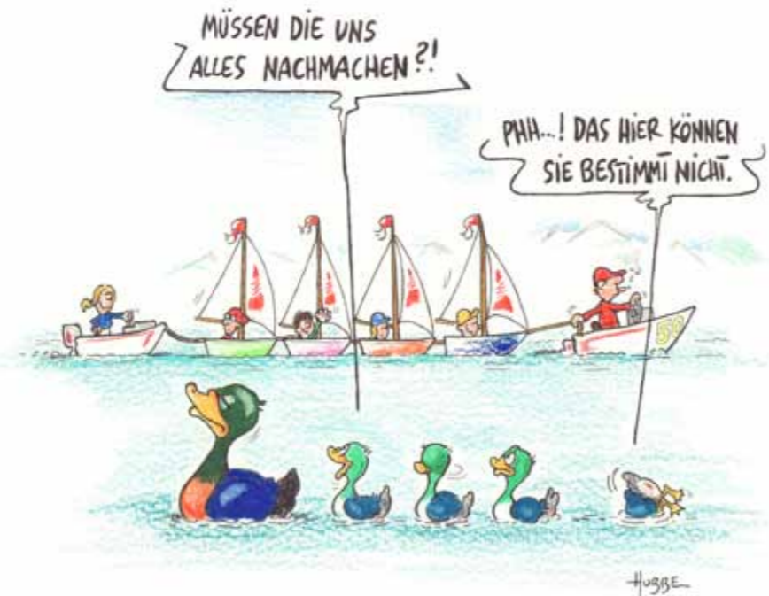
Illustration de Phil Hubbe.

«L'alimentation et les boissons relèvent des compétences d'Einstein St.Gallen. C'est pourquoi il est tout naturel pour nous d'aider Sailability.ch en lui fournissant un service traiteur. Ainsi, les participants au camp et nos collaborateurs sont en contact. Cela crée des émotions des deux côtés, émotions que nous ne pourrions ressentir avec une aide purement financière.»