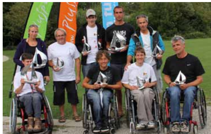
Les vainqueurs des premiers Swiss Access Class Championships en simple et double.