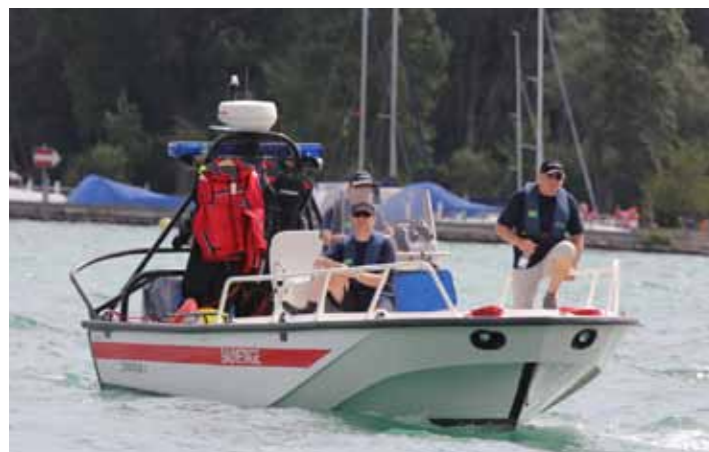
Pour la sécurité des participants, plusieurs bateaux de secours naviguaient sur le lac.