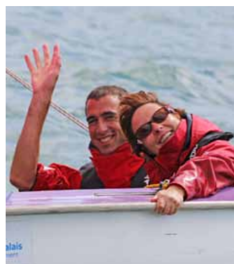
L'équipe française de voile a visiblement beaucoup aimé le lac de Bienne.