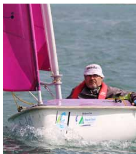
Deux dériveurs français étaient présents, en double et en simple.