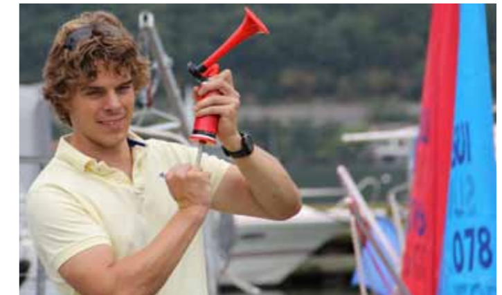
From ice to water by Jonas Hiller

«Je trouve formidable que des personnes avec un handicap aient la possibilité de naviguer de manière autonome.»