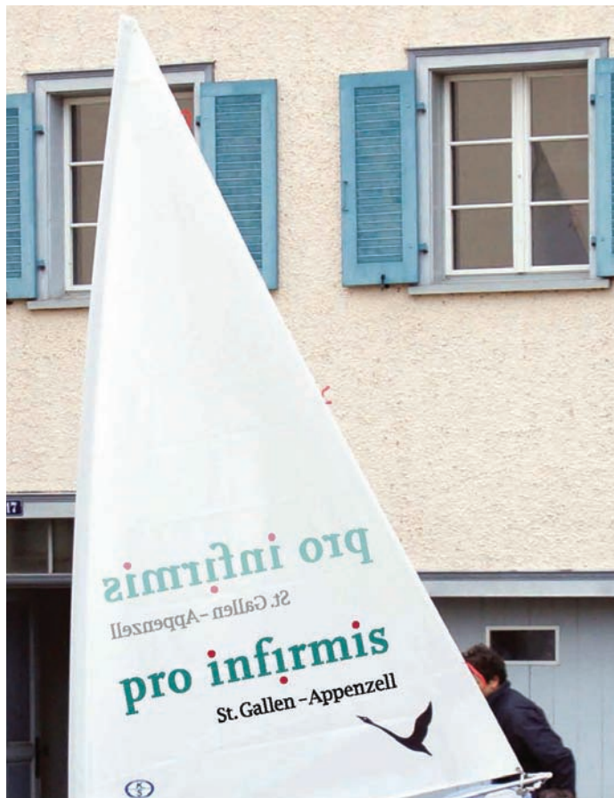
Eine der Hansa-303-Jollen wird ab dieser Saison das Logo der Pro Infirmis St.Gallen-Appenzell tragen.

Pro Infirmis St.Gallen-Appenzell unterhält Beratungsstellen in St.Gallen, Sargans, Wattwil, Herisau und Appenzell. In Altstätten, Wil und Rapperswil-Jona bietet sie Sprechstunden an. Sie hat im letzten Jahr 1734 Klientinnen und Klienten beraten. Dafür wurden insgesamt 18'338 Stunden aufgewendet. 93 Menschen hat die Fachstelle im selbständigen Wohnen begleitet; dies entspricht 4'775 Begleitstunden. Die 57 angebotenen Kurse im Bildungsclub Alpstein wurden von 430 Teilnehmenden besucht. Pro Infirmis ist politisch unabhängig und konfessionell neutral. Sie unterhält verschiedene Kantonsstellen. Die Geschäftsstelle von Pro Infirmis St.Gallen-Appenzell hat ihre Adresse an der Poststrasse 23 in St.Gallen.