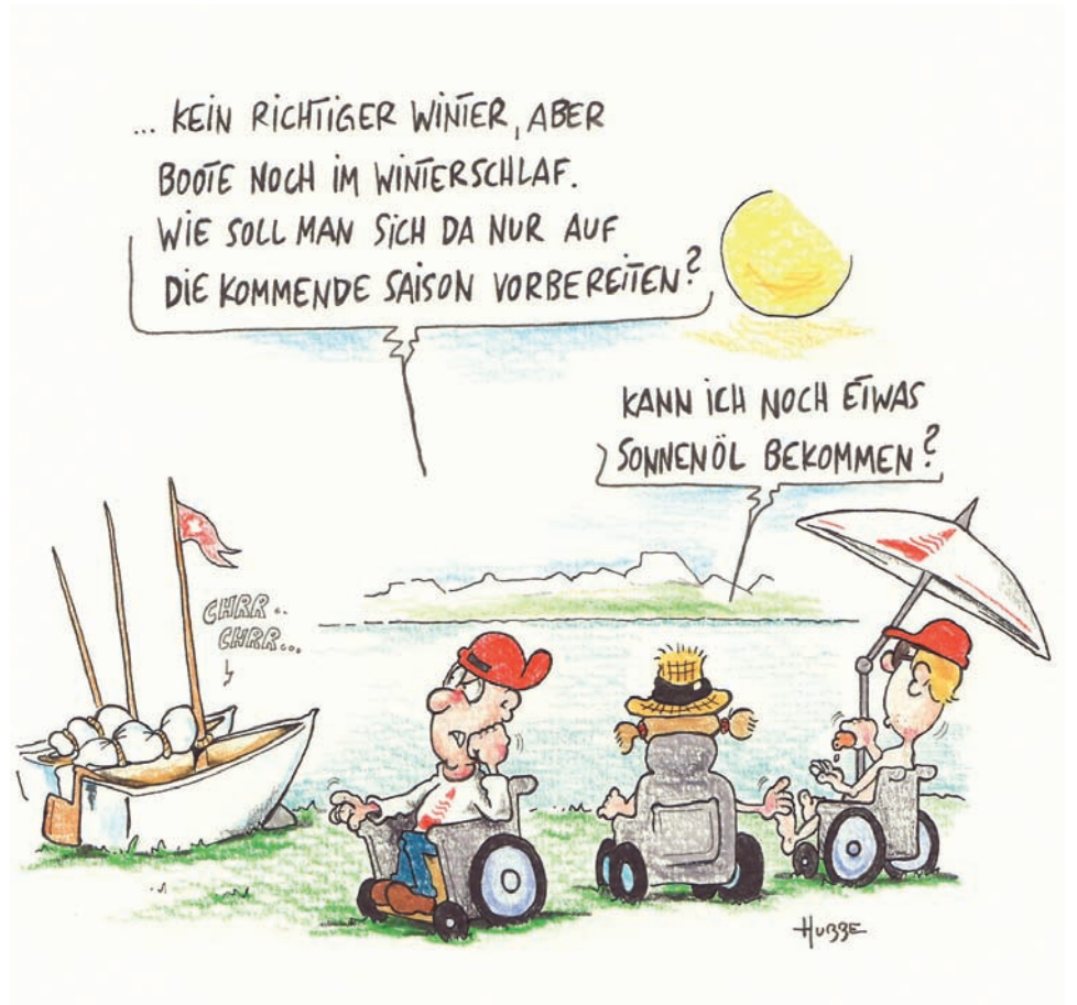
Cartoon von Phil Hubbe.