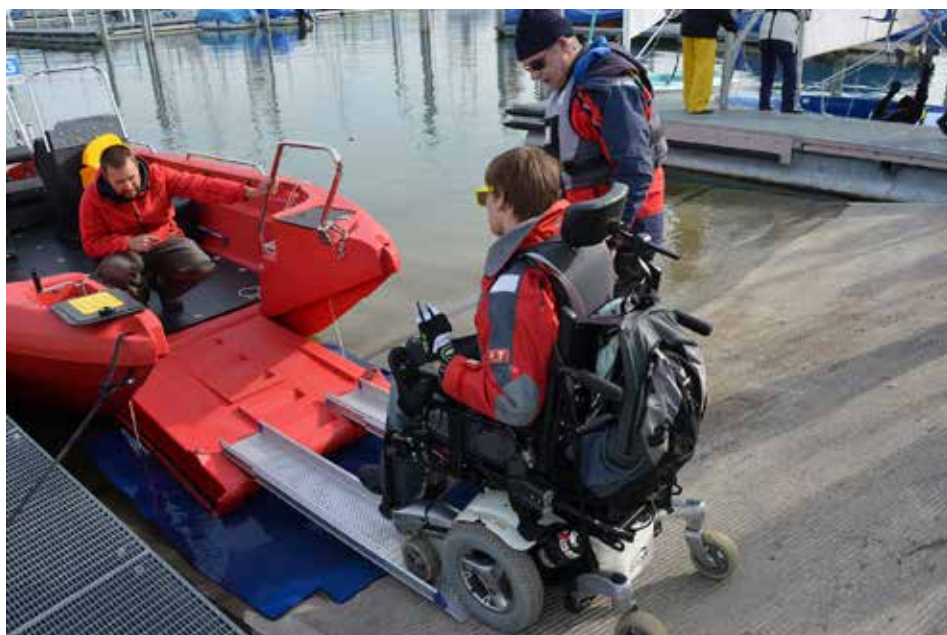
Über Rampen können Elektrorollstühle auf das neue Motorboot gelangen.

Dank der grosszügigen Unterstützung der Stiftung SYMPHASIS, der MBF Foundation Triesen und des Sportamts Thurgau kann Sailability.ch im Jahr 2018 eines der beiden Motor-Begleiteboote ersetzen. Zusammen mit dem Bootsbauer Christoph Wirth von der Wirth Freizeit AG, Arbon, wird der Verein das neue Boot so ausrüsten, dass in Zukunft der Transport von Elektrorollstühlen sicher möglich sein wird. Das Team von Sailability.ch freut sich auf den Neuworb und wird zu einem späteren Zeitpunkt das Boot ausführlich vorstellen.