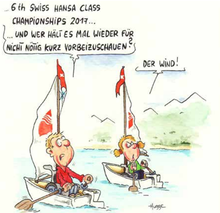
Cartoon von Phil Hubbe.

Olivier: «Die iPhone-App heisst SARA und erlaubt blinden und sehbehinderten Menschen, autonom einen Kurs zu segeln. Sie gibt unter anderem Angaben zur Geschwindigkeit, warnt vor Hindernissen oder kündigt eine notwendige Kursänderung an. Das Projekt wird mit Partnern laufend weiterentwickelt. Zurzeit ist sie in französischer, englischer, spanischer und italienischer Sprache erhältlich.»