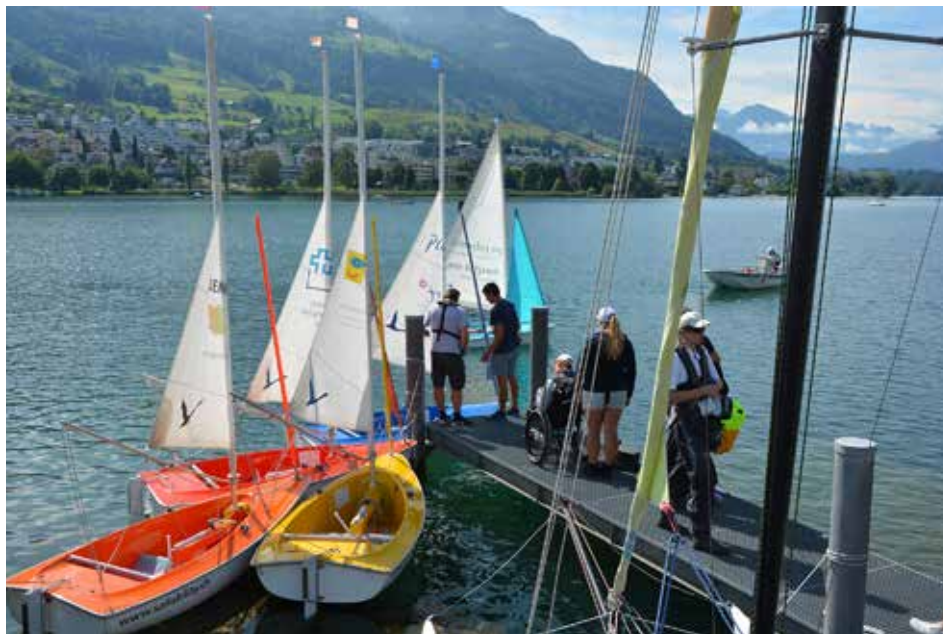
Start zu einer der fünf Etappen rund um den Bürgenstock.

Die erste Etappe führte von Küssnacht am Rigi nach Weggis Lützelau. Am nächsten Tag ging es weiter nach Luzern, wo die hungrige Segelgruppe vom Yacht-Club Luzern mit köstlichen Spaghettis verpflegt wurde. Auf der dritten Etappe zurück nach Weggis Lützelau passierten die Hansa 303 erneut den Bürgenstock, auf dem zurzeit ein luxuriöses Resorts entsteht. Die vierte Wegstrecke war von Dauerregen und herbstlich-kühlkalten Temperaturen geprägt. Sie endete im kleinen Hafen von Stansstad. Vor der Kulisse der kleinen Nidwalder Gemeinde gab es am letzten Segeltag bei idealem Wind einige Regatten. «Das war ein genialer Abschluss der Segelwoche», kommentierte ein Teilnehmer die Segelbedingungen. Während der ganzen Woche übernachteten die Teilnehmenden auf dem TCS-Campingplatz Buochs. Die barrierefreien Bungalows, die uns die Stiftung Cerebral freundlicherweise zur Verfügung stellte, erwiesen sich für die CampTeilnehmenden mit einer