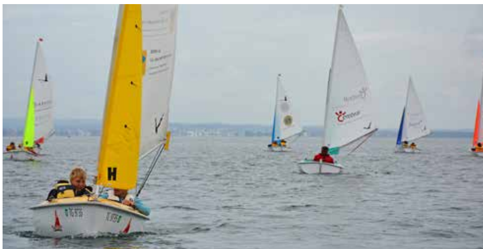
Am Schluss des Tages segelten die Schüler in einer Regatta um die Wette.